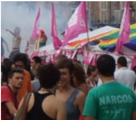
Torino 30 giugno 2007