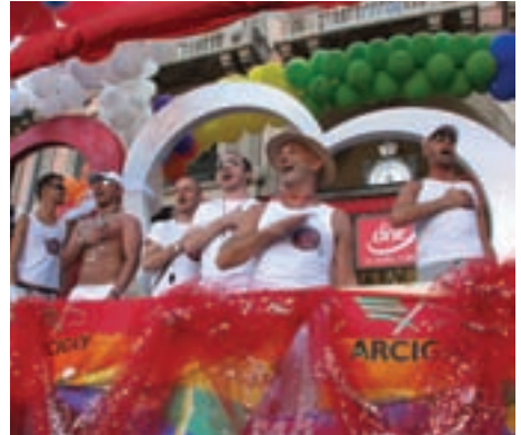
Milano 23 giugno 2007