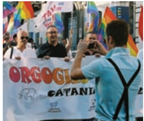
Catania 07 luglio 2007