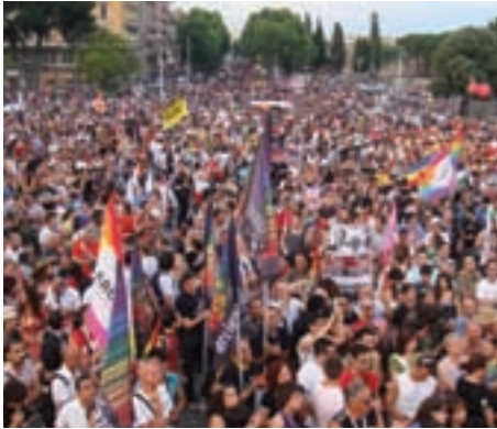
Roma 16 giugno 2007