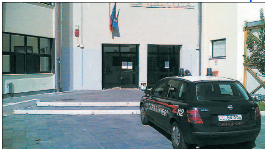
Il liceo scientifico «Gallotta» di Eboli, teatro dell'incursione dei vandali

Chiusura temporanea per ben sedici esercizi commerciali nel vallo di Diano causata dalla mancata emissione di scontrini e ricevute fiscali. Il blitz della Guardia di Finanza ha riguardato un negozio di fiori a Sant'Arsenio, uno di alimentari a Polla ed una macelleria a Sassano.